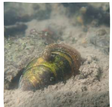
Mulettes observées sur la Luire par Vienne Nature