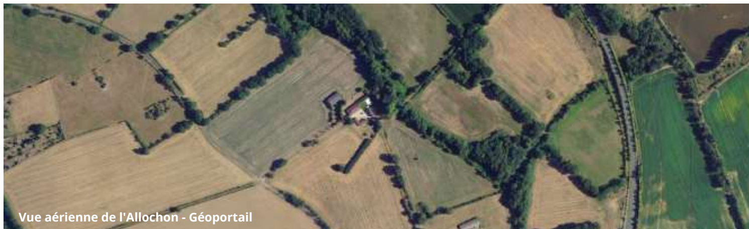
Vue aérienne de l'Allochon - Géoportail