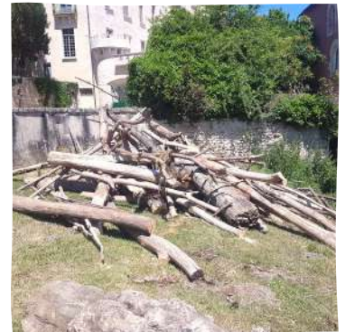
Embâcle retiré au moulin de Saint Savin - SYAGC

Enfin, des actions de sensibilisation ont été réalisées par l'animateur de la LPO : 2 classes de l'école de St Savin en ont bénéficié en 2022. Les élèves ont pu appréhender le cycle de l'eau et la préservation de la ressource en eau . Ils ont aussi pu découvrir le rôle des haies ainsi que l'existence des invertébrés aquatiques . Ces interventions s'élèvent à 3011 €.