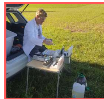
Mesures physico-chimiques sur le territoire du SYAGC.