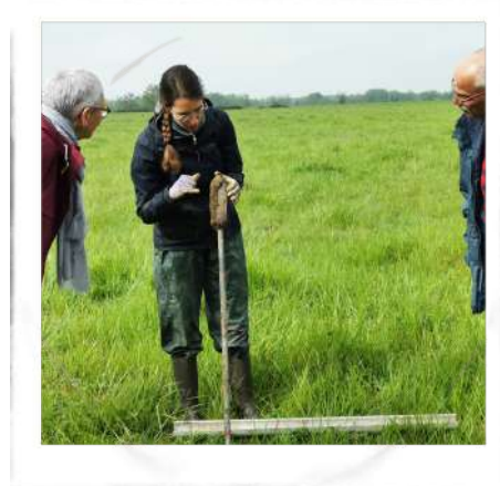
Présentation du protocole pour l'inventaire des zones humides - Vienne Nature

L'amélioration des connaissances sur les zones humides est utile car, lorsque certaines zones apparaissent en péril, les maitres d'ouvrage se concertent et programment les opérations indispensables à la restauration et la préservation des sites concernés. Les données récoltées sont par ailleurs mises à disposition afin d'intégrer les documents d'urbanisme.