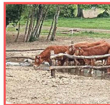
Abreuvoir et pose de clôtures réalisés par la CCVG.

Le SYAGC a poursuivi sa campagne de mesures pour établir l'état physico-chimique et l'hydrologie des affluents Gartempe et Creuse. Toutes les informations récoltées permettent d'avoir des données chiffrées, très utiles en période de forte sécheresse comme cette année. En 2022, le déficit de pluies hivernal et les fortes chaleurs estivales ont induit un niveau très faible des rivières. On observe ainsi une baisse de 11 à 40 % des débits estivaux sur les affluents Gartempe et Creuse comparativement à 2021.