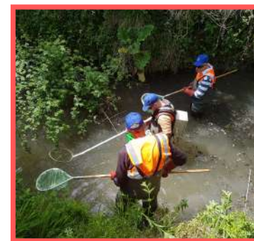
Une pêche électrique sur la Luire par la FDAAPPMA 86.

Les différents aménagements pilotés en 2022 par ces 3 maitres d'ouvrage ont permis de restaurer 3.7 km de cours d'eau sur le territoire afin d'atteindre le bon état écologique. Des indicateurs de suivi ont été établis afin de voir l'évolution de la qualité du milieu sur les secteurs aménagés.