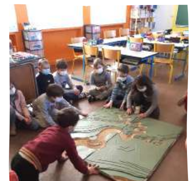
Sensibilisation scolaire à St Savin - LPO

Ces actions complètent celles précédemment décrites car elles permettent notamment une meilleure connaissance des milieux et sa transmission.