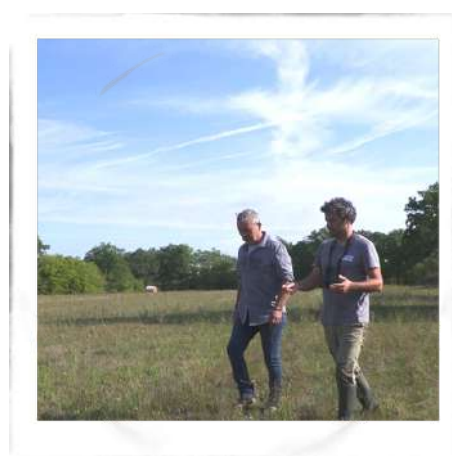
Discussion avec le gestionnaire d'une parcelle - CEN NA

Ces données sont de même utiles au CEN afin de cibler l'acquisition des parcelles qui présentent de forts enjeux.